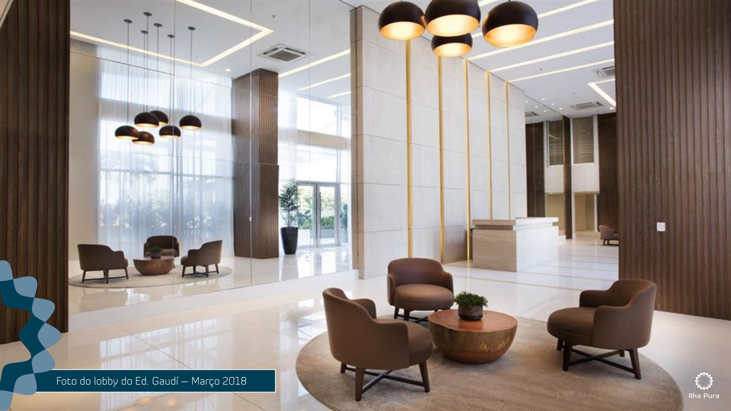
Foto do lobby do Ed. Gaudí – Março 2018