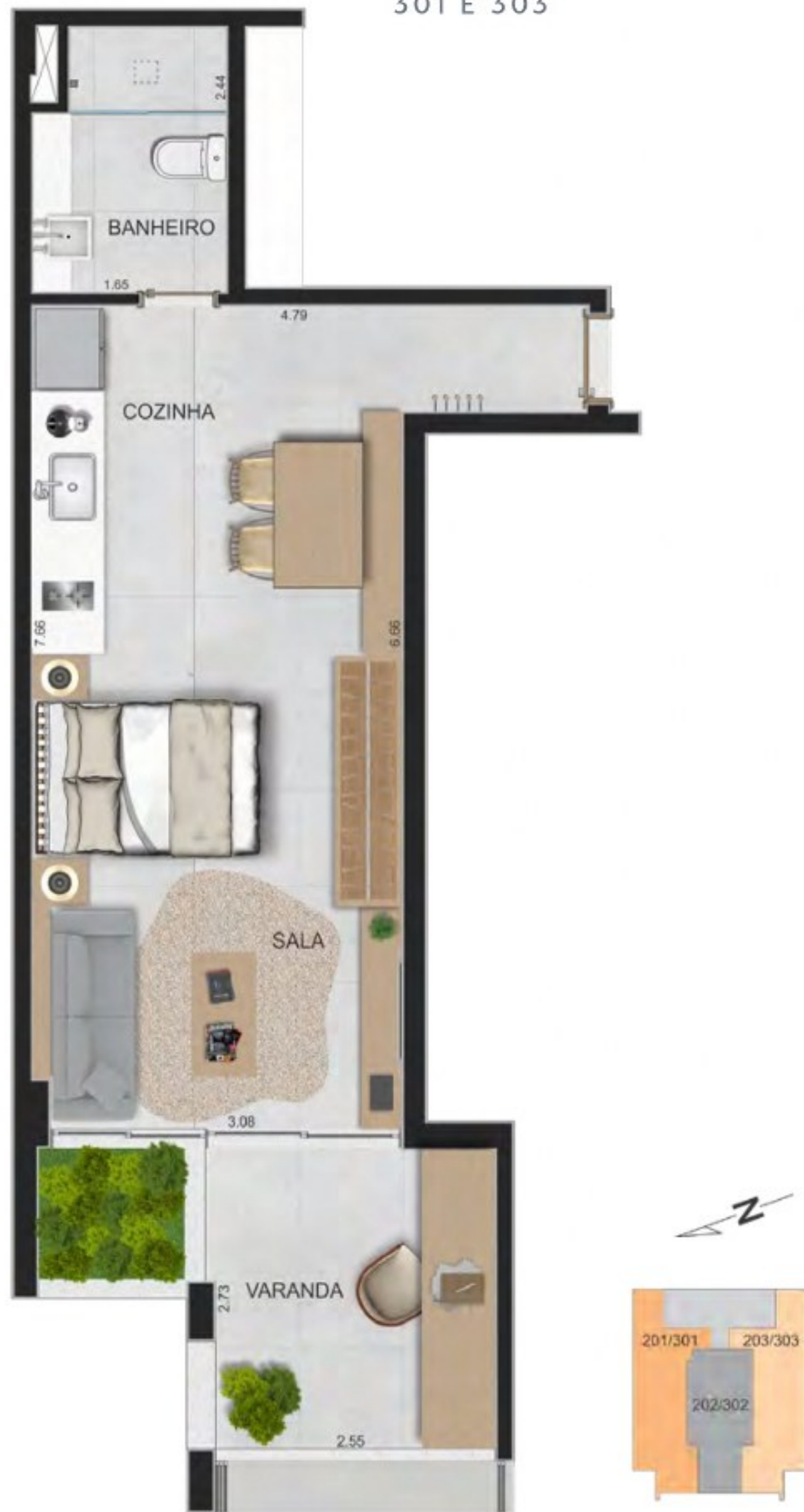
APTOS. 201, 203, 301 E 303